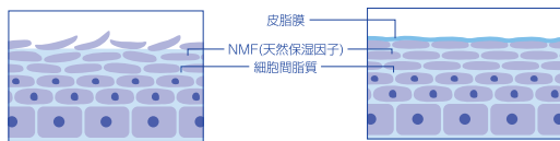
バリア機能が低下した肌の状態

ナノとは10億分の1のミクロな世界を示す単位。 「アレルギー」は、敏感肌・乾燥肌・不安定肌のために、 製剤化技術を研究し、ミクロを超えた「ナノ粒子」技術を採用しました。 このナノ粒子は、角質層に浸透して肌をやさしく、みずみずしく整えます。さらに、べとつかず使いやすい心地で、 乱れがちな角質層をベールのようにつつみ、健康で美しい肌質へと導きます。