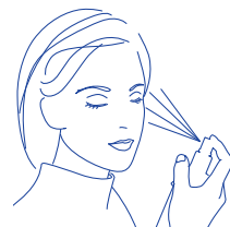
顔の左右両側からスプレーしてください。